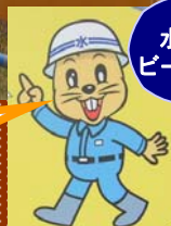
水防マスコット ビーバーのまもるくん