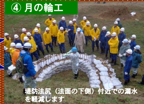
堤防法尻（法面の下側）付近での漏水を軽減します