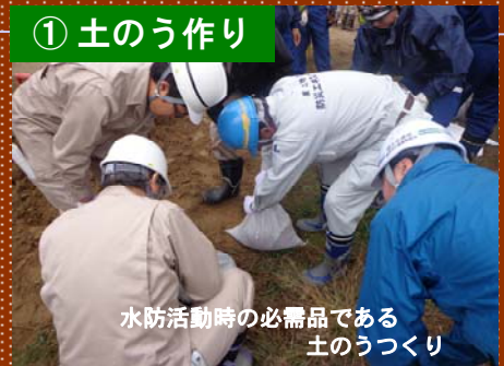
水防活動時の必需品である土のうづくり