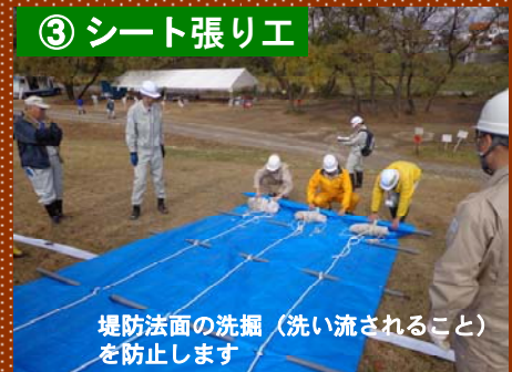
堤防法面の洗掘（洗い流されること）を防止します