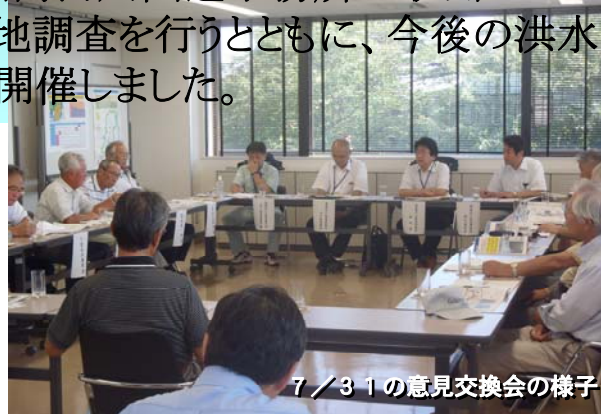
7/31の意見交換会の様子

水門町町内会、安原町内会、阿久津町会、横川町会、太郎殿町内会、福原東第7町内会の6町会長