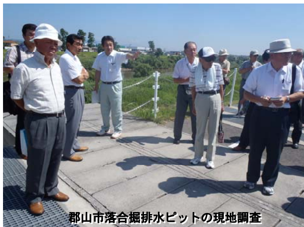
郡山市落合掘排水ピットの現地調査