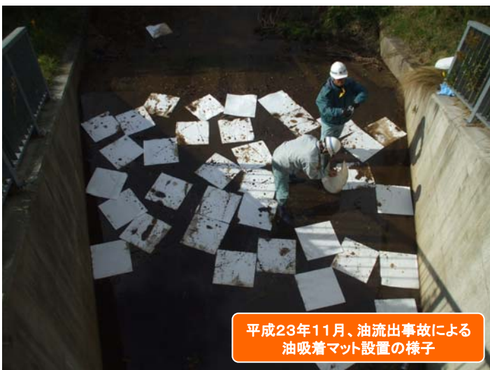
平成23年11月、油流出事故による油吸着マット設置の様子

そのような流出によっての水質事故を起こすと、その油処理のために設置するオイルフェンスや油吸着マットなどの設置経費は、原因者の負担となります。十分に注意して下さい。