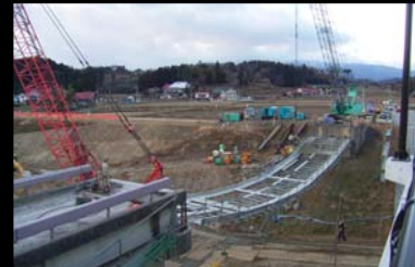
橋桁をクレーンで吊り下げ、河川敷で小割にして撤去しました。