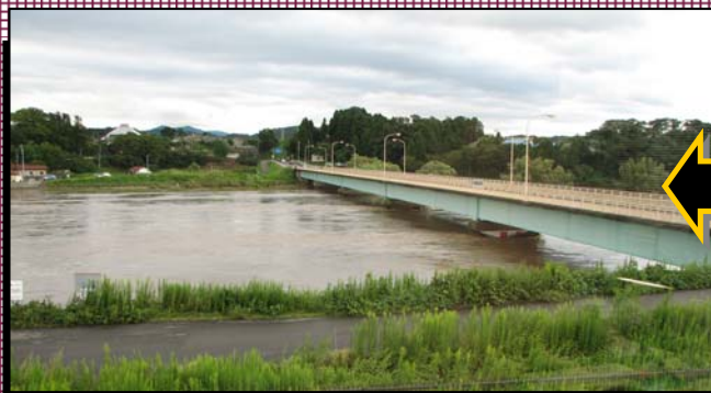
阿久津橋付近 9月22日の朝（水位9.10m）

9月21日、台風15号の接近により翌日まで降り続いた大雨で、郡山出張所管内の阿武隈川では阿久津観測所で9.25m、二本松観測所で11.57mと過去最高水位を記録しました。また、須賀川及び本宮観測所でも、戦後の最高水位を記録しました。郡山出張所では管内133箇所の水閘門施設において操作員が出動し、河川水位の確認やゲート操作等の洪水対応を行いました。また、排水ポンプ車も出動し、内水排除を行いました。