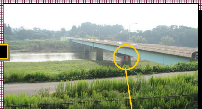
阿久津橋付近 平常の様子（水位0.30m）