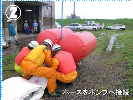
ホースをポンプへ接続