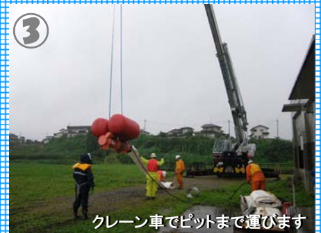
クレーン車でピットまで運びます