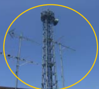
郡山河川局 通信用鉄塔