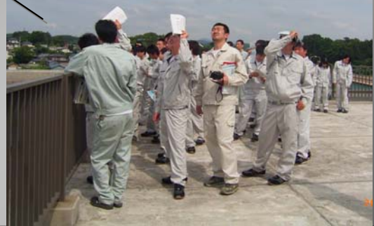
平工業高校のみなさん