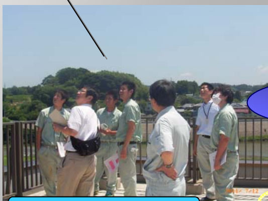
勿来工業高校のみなさん