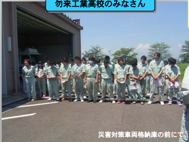
災害対策車両格納庫の前にて