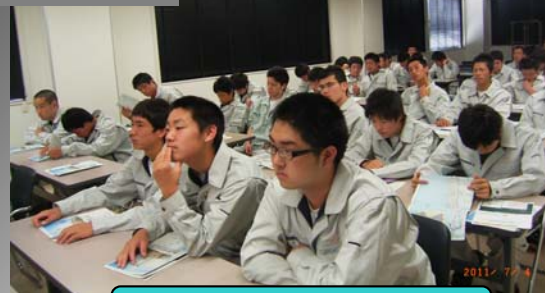
会議室にて説明を聞いている様子

7月4日に平工業高等学校の2年生(41名)、7月12日に勿来工業高等学校の3年生(28名)が郡山河川防災センターの見学を訪れ、郡山出張所で行われている河川管理の仕事や、東日本大震災発生時の郡山出張所の対応などの説明をうけるとともに、施設や災害対策車などを見学し学んでいただきました。