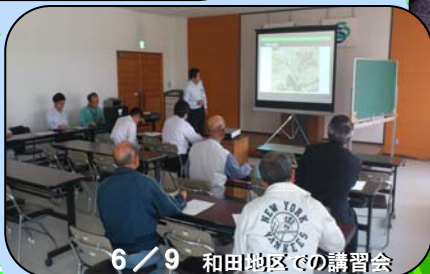
6/9 和田地区での講習会