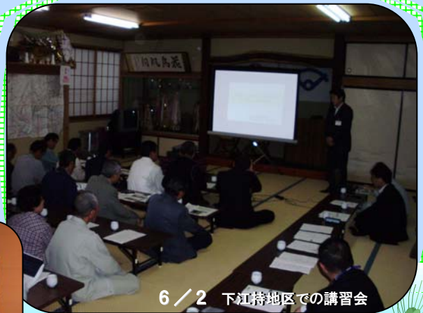
6/2 下江持地区での講習会