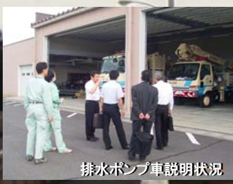
排水ポンプ車説明状況

協議会では、今後、北陸地方整備局と連携して地域防災・交流活動拠点を整備する予定であり、その先進地として郡山防災ステーションを訪ねたものです。