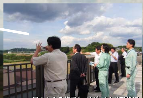
屋上からの施設(ヘリポート)説明状況