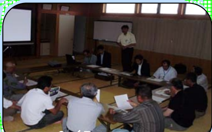
6/7 浜尾地区での講習会

参加者らは、除草機械の点検方法や作業時の注意点、熱中症対策等に関して真剣な様子で講習を受けていました。