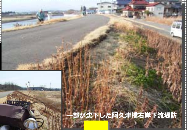
一部が沈下した阿久津橋右岸下流堤防