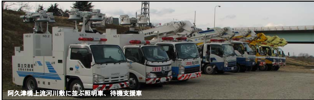
阿久津橋上流河川敷に並ぶ照明車、待機支援車