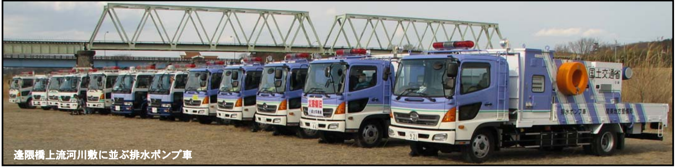
逢隈橋上流河川敷に並ぶ排水ポンプ車