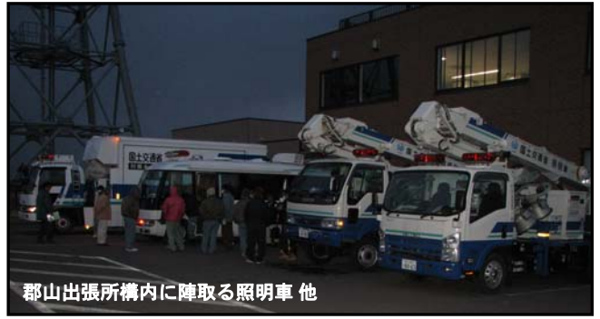
郡山出張所構内に陣取る照明車 他