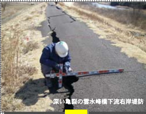
深い亀裂の雲水峰橋下流右岸堤防