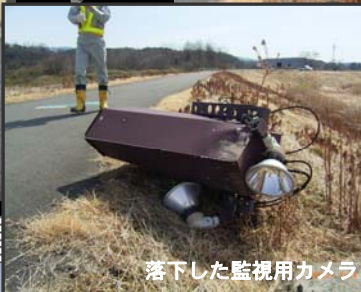
落下した監視用カメラ