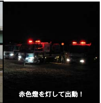
赤色燈を灯して出動!