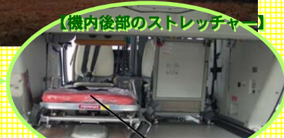
患者さんに乗せるスペース