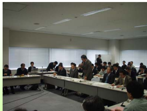
田上河川部長による挨拶

また、整備計画策定のために、学識経験者や流域住民、自治体の長等の意見を反映させるため阿武隈川水系河川整備計画委員会を設置しており、平成19年3月に阿武隈川水系河川整備計画を策定し、今後概ね30年間の事業計画をまとめております。