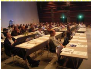
【講習会全体の様子】