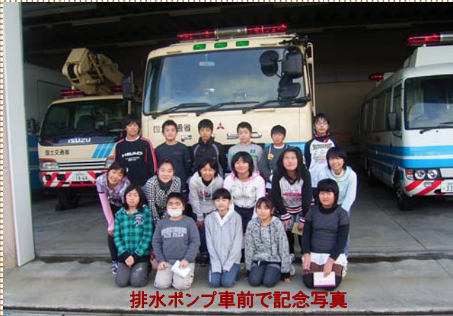
排水ポンプ車前で記念写真

12月3日に郡山市立宮城小学校の5・6年生の児童のみなさん(17名)が理科学習のため郡山河川防災センターを訪れました。