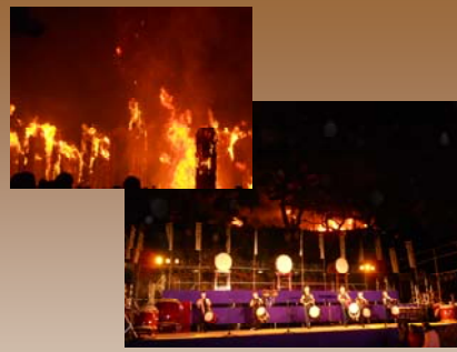
松明あかし(須賀川市)