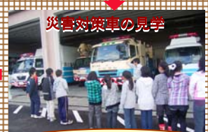
災害対策車の見学