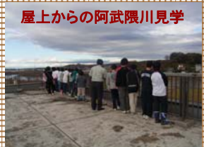
屋上からの阿武隈川見学