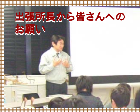
出張所長から皆さんへのお願い

【お願い】 ①家に帰ったらお家の人と防災について話し合おう。 ②洪水のときには河川に絶対近づかない。