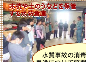
木杭や土のうなどを保管する水防倉庫