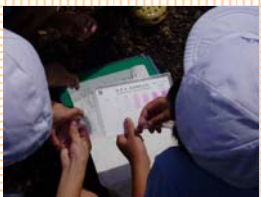
簡易水質分析調査状況 ②