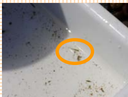
はっきりとわかるのはメダカです。