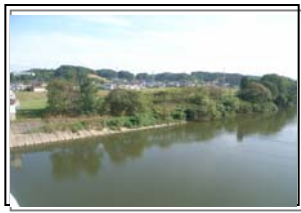
二本松市安達ヶ原 (護岸・掘削工事)