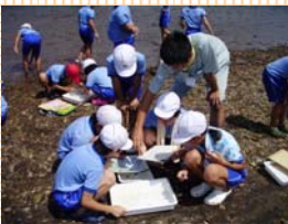
採ってきた川底の石の裏から水生生物発見!