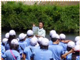
調査の説明を真剣にきいているみなさん。