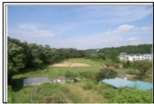
二本松市北トロミ (築堤工事)

施工業者 株式会社 小野工業所 施工場所 二本松市トロミ・安達ヶ原地内 工期 H22.9.1 ~ H23.3.10