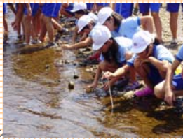
簡易水質分析調査状況 ①