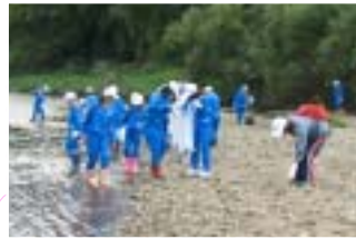
ゴミ拾いをしている生徒さんの様子

みんなさん、ゴミや流木を拾っていただきありがとうございます。来年の夏には、釈迦堂川をホタルが飛んでいるのが見れるといいね。