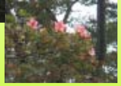
ツツジの花 (須賀川市乙字)