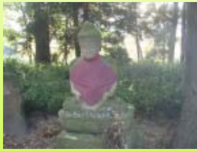
護摩堂趾供養塔 (郡山市田村町御代田橋付近)