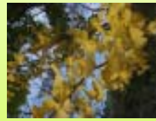
色づいたイチョウ (二本松市)