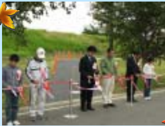
テープカットをする 須賀川市長と事務所長(中央)

式には、須賀川市長や福島河川国道事務所長、須賀川市民歩こう会、阿武隈小学校の児童さん、地域住民の方々(約50名)が参加され、秋晴れの中、色づく木々や遊水地の景色を楽しみながら歩きました。