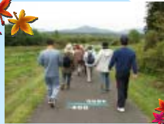
ウォーキングの様子