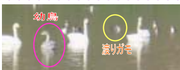
(郡山市富久山町堂坂)