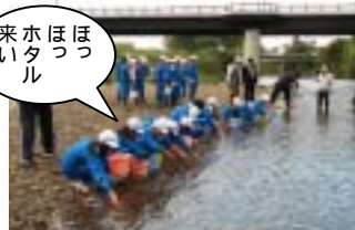
カワニナの放流の様子

みんなさん、ゴミや流木を拾っていただきありがとうございます。来年の夏には、釈迦堂川をホタルが飛んでいるのが見れるといいね。