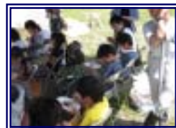
食育として外来魚を食べ命の尊さを学びました。フライを食べた感想は、白身で臭みもなく身が柔らかくおいしかったそうです。