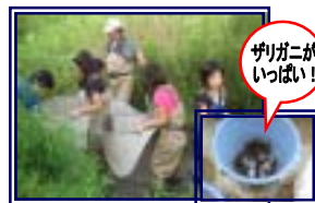
蛇行水路に生息する水生生物をみんなで捕まえました。