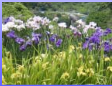
あやめの花と智恵子大橋 (二本松市)