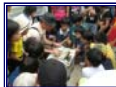
ブラックバスやブルーギルのからだを解剖し、在来魚の生息にどのように影響を及ぼすのかを勉強しました。