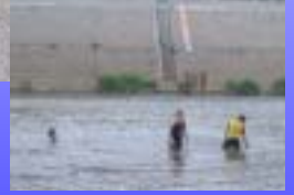
川遊びを楽しむ子供達 (阿久津橋河川敷)