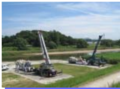
排水ポンプの設置の様子