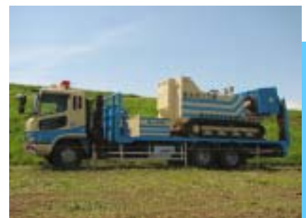
クローラー式排水ポンプ車