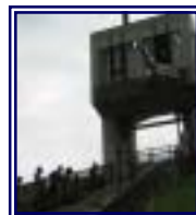
水閘門操作員さんの協力で、普段見ることの出来ない浜尾排水門の見学をしました。