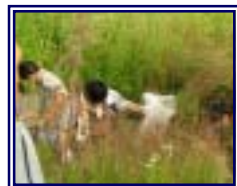
自然の大切さを知るためゴミ拾いのボランティア活動をしました。