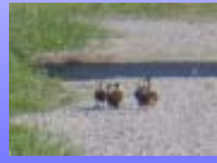
カルガモ親子散歩中 (郡山防災センター敷地内)