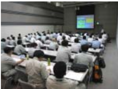
学科講習会の様子

午後からは、阿久津橋の河川敷で排水ポンプ車5台を使用し、内水排除の実技講習会も実施されました。