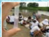
簡易水質分析調査状況