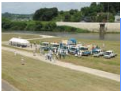
実技講習会の様子