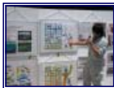
浜尾遊水地のはたらきやそこに生息する水生生物や植物について説明をする様子。

また、NHKが取材に訪れ、13日の夜にTV放送されました。これを機に外来魚の違法な放流やゴミを捨てない人が増え、自然への愛護がより多くの人に伝わることを期待しています。