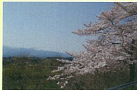
菅田橋付近 (二本松市江口)