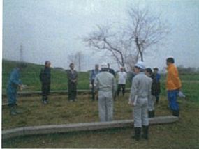
日出山水辺の小楽校(郡山市)

4月17日に、水辺の利用が増加するゴールデンウィークを前に、河川を安全に利用して頂くため、危険な場所や周辺施設を郡山出張所と福島河川国道事務所、須賀川市土木課、都市計画課、郡山市河川課、永盛小学校、アメンボウクラブ、河川愛護モニターが安全点検を行いました。