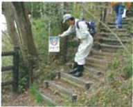
標示看板もしっかりチェック(^o^)/

指摘のあった箇所は早急に対処します!! また、水辺を利用される時は気を付けて楽しんで下さい。