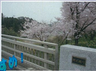
小和滝橋 (郡山市西田町)