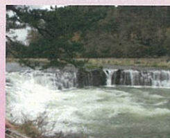
乙字ヶ滝 (須賀川市)