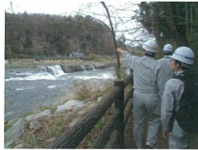
乙字水辺の小楽校(玉川村)