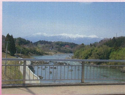
二本松市智恵子大橋からの風景