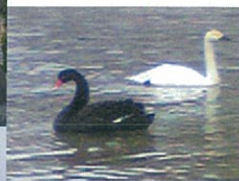
本宮市白鳥飛来地 (コクチョウと白鳥)