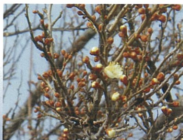
梅の花 (郡山市南小泉水質監視所)