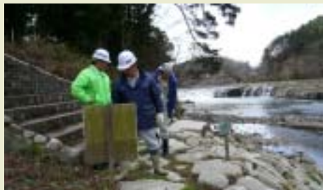
乙字ヶ滝(玉川村)周辺のパトロール

指摘のあった箇所は既に対処済みですが、水辺を利用される時は気を付けて楽しんでください。