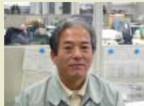
山川許認可等補助員