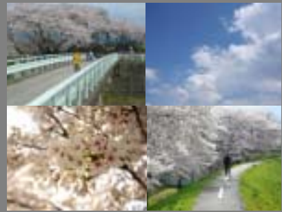
満開の桜つづみ(郡山市 永盛小学校)