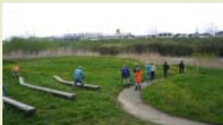
水辺の小楽校(郡山市)のパトロール