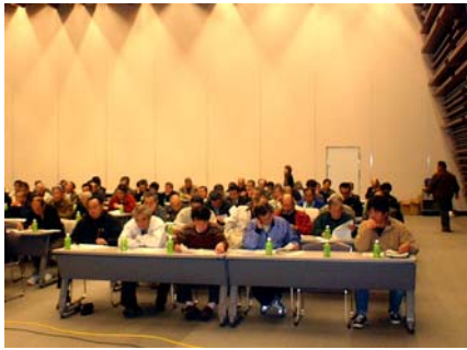
熱心な姿勢の操作員さん

今年度の講習会は12月7日、郡山市のビッグパレットふくしまで行われ、168名の操作員が参加しました。福島河川国道事務所からはこの1年間の出水状況や要望への取り組み状況、操作にそっての心がまえ等が説明された後、意見交換会に入りました。操作員からは上屋設置への感謝とともに各種改善点の提案等が出され、有意義な会議となりました。