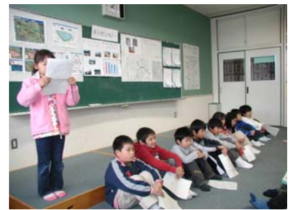
良く発表できてるよ(∇^)/