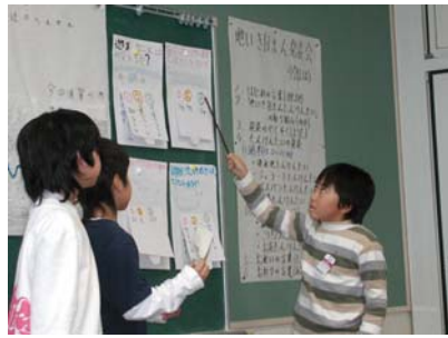
浜尾遊水地の発表の様子