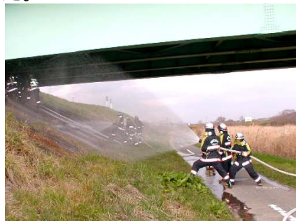
火事が発生し、一人逃げ遅れがいるという想定で消火と救助の訓練