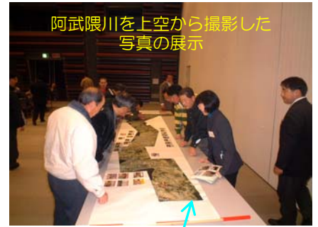
阿武隈川を上空から撮影した写真の展示