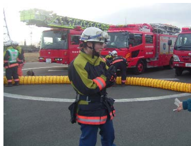
「人の役に立つ仕事をしたい」と話をしていた女性消防隊員さん