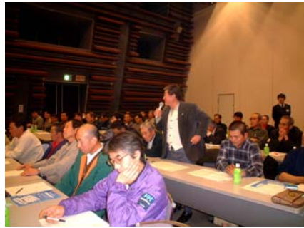
活発な意見交換会の様子