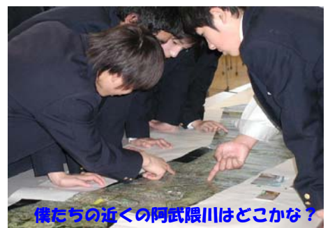
僕たちの近くの阿武隈川はどこかな?

★ 出前講座とは、河川や道路・砂防の知りたいことや聞きたいことについて、当事務所の職員が直接出向いて、最新情報を交えつつ、わかりやすくお話しさせていただくものです。小・中・高向けもありますので、総合学習の授業にもご利用下さい。