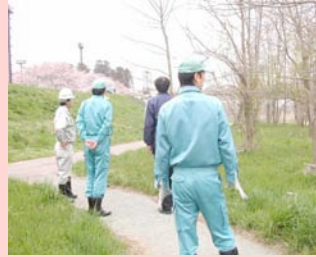
<日出山水辺の小楽校>

4月19日に水辺周辺の利用が増加するGWを前に、安全に利用していただくために、水辺周辺の施設などについて点検しました。ご協力いただいた皆さんありがとうございました。