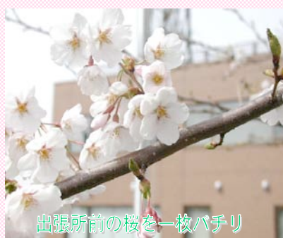
出張所前の桜を一枚ハチリ