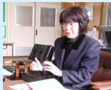
片野校長先生の熱心さが伝わってきました。