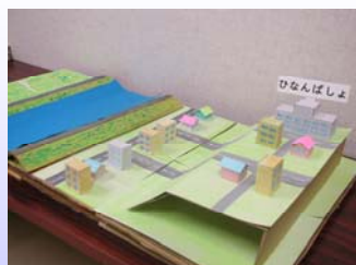
説明の時に使った模型です！

8月30日、小泉小学校において「洪水に備えて」という内容で出前講座を実施しました。小泉小学校では、阿武隈川の近くに位置していることもあり、防災教育の一環として水防教室を実施しております。今回はその水防教室の中で、「どのようにして洪水がおきるか」「洪水の怖さ」「洪水時の避難」などについて、模型やスライドを使用して説明しました。