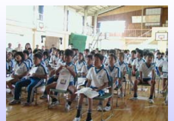
真剣に、郡山出張所長の話を聞いています。