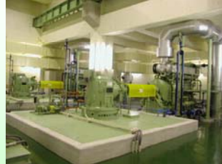
雨水ポンプ用原動機