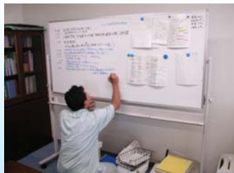
時系列に情報整理をしています。