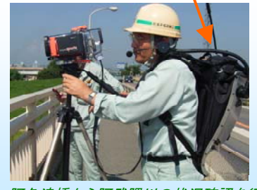
阿久津橋から阿武隈川の状況確認を行い、本部へ報告(こちら現場です!!)