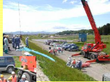
クローラ自走ラジコン車