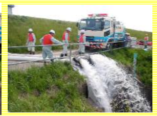
↑排水ホースのセッティングです!!