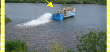
↑水面に浮いて排水します!