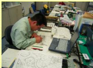
真剣に情報の整理を行っています！！