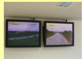
災害対策室にあるCCTVで状況確認