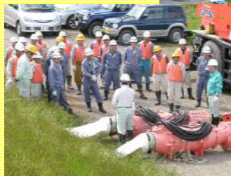
←排水ポンプの設置説明状況