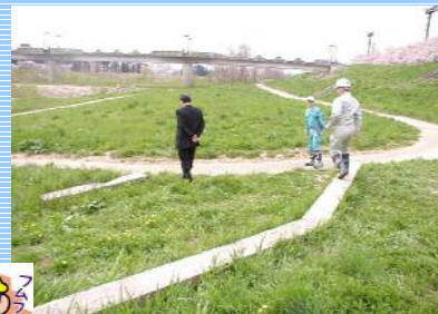
<日出山水辺の小楽校>