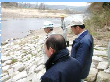
<乙字水辺の小楽校>

水辺周辺の利用が増加するGWを前に、安全に利用していただくために、水辺周辺の施設などについて点検を行いました。ご協力いただいた皆さんありがとうございました。