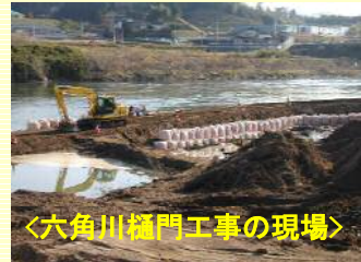
＜六角川樋門工事の現場＞