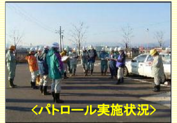
＜パトロール実施状況＞