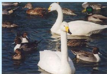
きれいな白鳥さんです