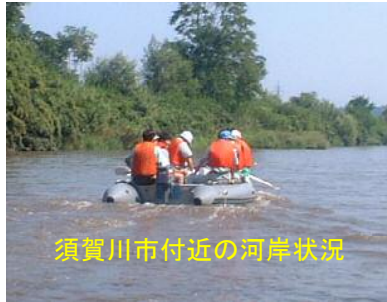
須賀川市付近の河岸状況