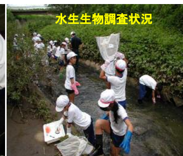
水生生物調査状況