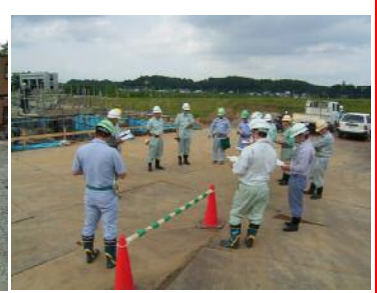
↓反省会の様子です！