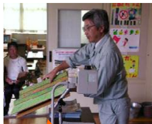
郡山出張所長が説明しました。