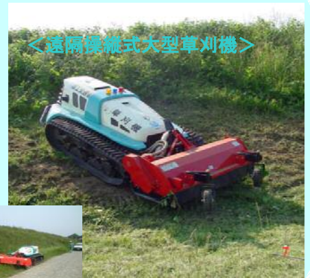
＜遠隔操縦式大型草刈機＞

今年も堤防除草が始まりました。遠隔操縦により、作業員の疲労・危険性も少なく、スピーディーに刈っています。