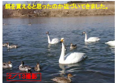
餌を買えると思ったのか近づいてきました。