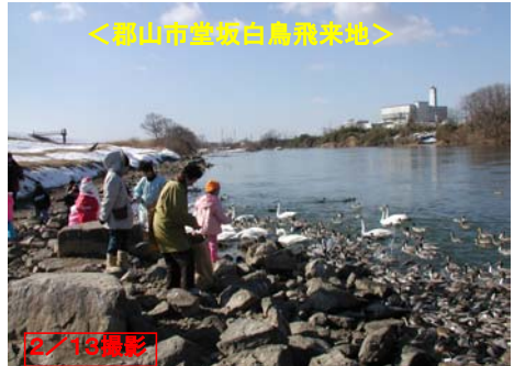
<郡山市堂坂白鳥飛来地>