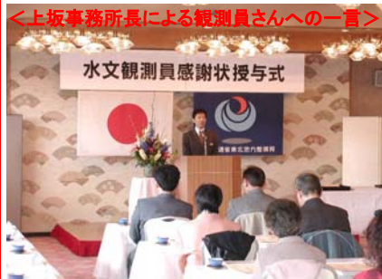
<上坂事務所長による観測員さんへの一言>