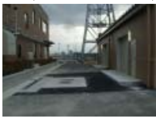
郡山地区取水施設補修等工事 (施工:公益土木(株))