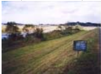
郡山管内下流堤防除草その他工事 (施工:川名建設工業)