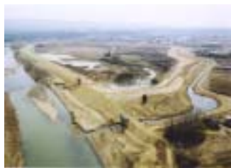
浜尾遊水地築堤工事 (施工:ピーエス三菱)