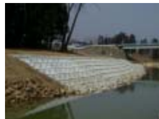
笹川地区工事 (施工:三城工業(株))