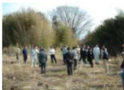
浜尾遊水地現地調査

3月3日に浜尾遊水地利用ワークショップ意見交換会、24日に現地調査が行われました。自然の有効利用と、多数の観光・利用者を期待したいですね。