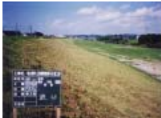
郡山管内上流堤防除草その他工事 (施工:石橋建設工業(株))