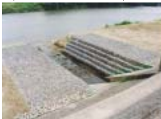
本宮第1樋管外補修工事 (施工:川名建設工業(株))