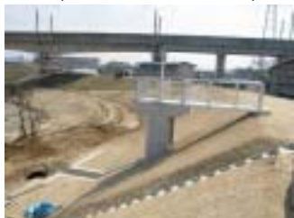
笹原川第4樋管改築工事 (施工:三栄建設(株))