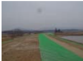
浜尾地区築堤工事 (施工:共栄建設工業(株))