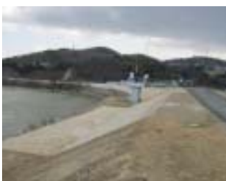
高木地区堤防護岸工事 (施工:管野建設工業(株))