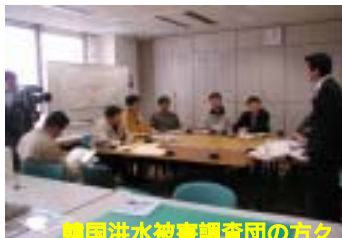
韓国洪水被害調査団の方々