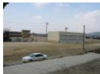
本宮地区格納庫他新築工事 (施工:國分工業(株))