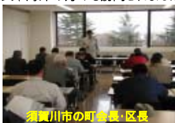
須賀川市の町会長・区長