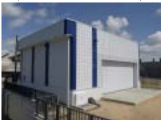
南川排水機場上屋新築工事 (施工:(株)陰山工務店)