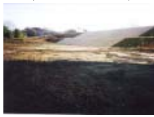
郡山管内維持補修工事 (施工:(株)武田工務店)