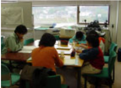
芳賀小学校のみなさん