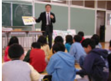
小原田小学校のみなさん

出前講座が11月21日に郡山市小原田小学校で行われました。今回は、主に河川の水質などについて、担当者から、お話がありました。