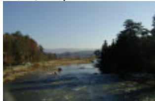
乙字ヶ滝(乙字橋から撮影)