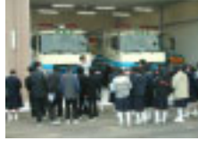
排水ポンプ車の見学