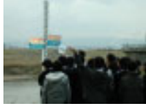
阿久津水位観測所にて

芳賀小学校と大槻中学校のみなさんが、総合学習の一貫で、河川防災センター及び、水位観測所等の施設を見学されました。職員の説明を熱心に聞かれていました。