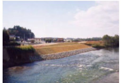
市野関地区工事(須賀川市) 施工:三金興業株式会社