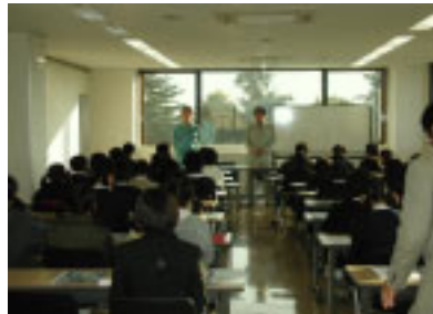
大槻中学校のみなさん