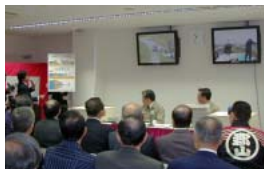
河川情報装置起動式