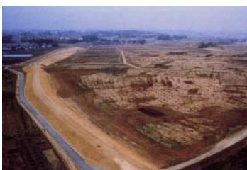
工事が進む浜尾遊水地(須賀川市)