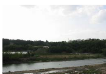
築堤工事中の菅沼地区(郡山市)