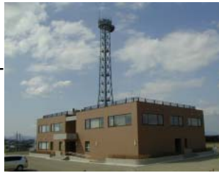
郡山河川防災センター

阿久津橋の近くで郡山河川防災センターが完成し、4月15日に開所式が挙行されました。郡山河川防災センターには、水防センター(郡山市)と集中管理センター(福島工事事務所)の施設が入っています。この施設は、緊急時の水防資材等の備蓄、洪水時の河川施設の保全と復旧活動と郡山市が実施する水防活動基地などとして利用されます。