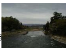
乙字ヶ滝(乙字橋から)

新緑の季節になりました。乙字ヶ滝の右岸の散策路が完成していますので、ご利用下さい。