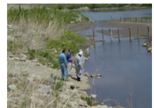
郡山水辺の小楽校