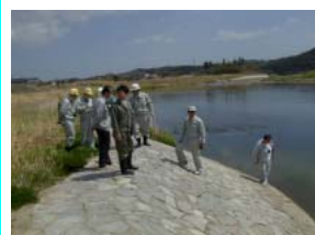
本宮水辺の小楽校

河川水辺周辺の利用が増加する時期になってきたのに伴い、河川を安全に利用していただくために、水辺周辺の施設等について、安全利用点検が実施されました。