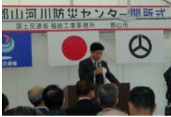
大西所長概要説明