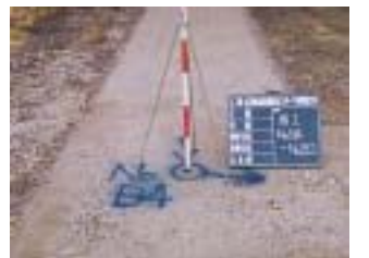
郡山河川防災センター下水管渠 工事 (施工:陰山建設)