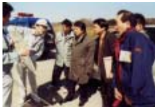
東北地方整備局 河川管理課 (3/13:浜尾遊水地)

今月も郡山出張所管内の工事現場視察がありました。今後の業務の参考にしてください。