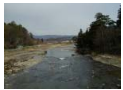
乙字ヶ滝(乙字橋から)

編集後記 平成13年度もあと、わずかりなりましたが、郡山出張所グラフィティは、みなさまのご支援により、14号まで、発行できました。4月以降についても、新スタッフを加えて発行していきますので、よろしくお願いします。