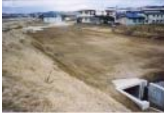
本宮河川防災ステーション整備工事 (施工:菅野建設工業) 完成済

今年度(3月末まで)も残り少しくなりました。今回は、2月から3月末までに完成、または、完成予定工事を紹介します。関係者のみなさん、工事完成まで、もう少しです。がんばってください！！