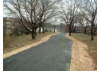
郡山管内下流堤防除草その他工事 (施工:川名建設工業)