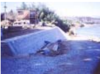
島寺地区工事(郡山市) (施工:山地組)