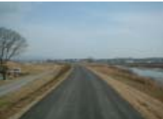
郡山管内上流堤防除草その他 工事 (施工:石橋建設工業)