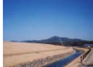
浜尾遊水地工事(須賀川市) (施工:佐藤工業)