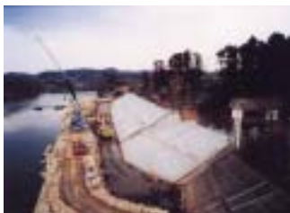
安達ヶ原地区工事(二本松市) (施工:野地組)