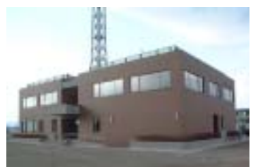
郡山河川防災センター新築工事 (施工:陰山建設)