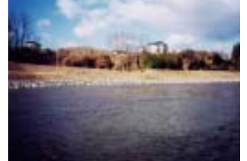
下川原地区工事(須賀川市) (施工:三金・県南JV)