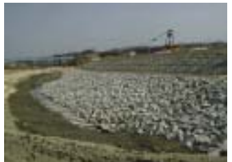
川原地区工事(郡山市) (施工:壁巢建設)