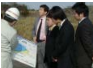
国土交通大学校 (3/19:浜尾遊水地等)