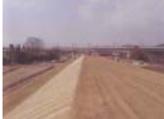
梅沢中流地区工事(郡山市) (施工:陰山組)