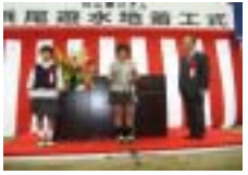
郡山市立永盛小学校