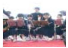
須賀川市立第三中学校