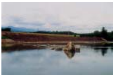
前田第一地区工事 施工：(株)野地組

二本松地区で、9月に前田第1地区工事、舟石地区工事が完成しました。これからも、ぞくぞく工事が完成していきます。