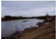
取上川樋門工事 (須賀川市)

10月11日の出水により、低水護岸工事等に被害がでました。工事完成まで、がんばれ！