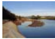
竜崎地区工事 (玉川村)