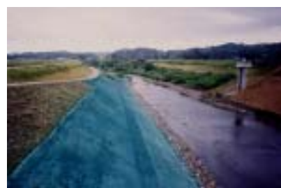
舟石地区工事 施工：石橋建設工業