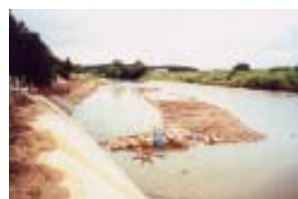
9月13日11時 仮締め切被災状況 竜崎地区工事