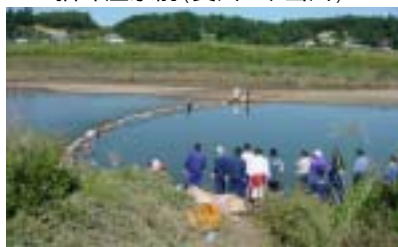
須賀川市江持付近