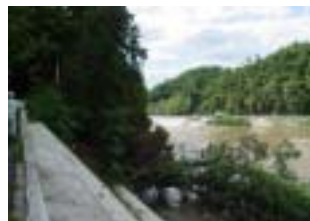
河岸樹木の倒木状況 乙字ヶ滝下流約200m右岸

台風15号の影響により、阿武隈川流域では、9月9日の夜から雨が降り始め、ほぼ2日間降り続け、阿武隈川上流の真船雨量観測所では、181mmの総雨量を観測しました。須賀川水位観測所では、警戒水位を超え、ポンプ等の出動、水防団の待機を行いました。樋門・樋管39カ所において、出動を指示しました。 操作員のみなさん、たいへんお疲れさまでした。 また、低水護岸の工事現場では、仮締め切りを越え被害が出ています。あらためて、低水護岸工事の大変さを感じました。