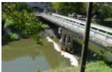
猫啼温泉前(支川 今出川)

9月22日水質事故が発生しました。石川町大字双里地内から重油が流出したもので、出張所では事故発生後、速やかに自治体等と連携しながらオイルフェンスを設置し、下流への流出・拡大を防ぎました。 真夜中の河川状況の調査、オイルフェンス設置を担当されたみなさんご苦労さまでした。