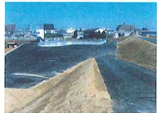
排水 落合堀内水対策 工 市日和田町 水 昭建建設 池 完成 建設 工 工 業