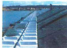
堂坂地区(郡山市水穴)護岸据え付け状況 施工 東洋建設