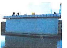
仲の町橋架設(須賀川市)橋架設状況 施工 東日本コンクリート