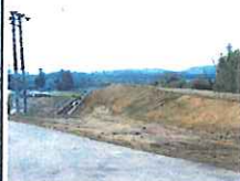
梅沢上流(郡山市梅沢)築堤完成 施工: 共立・むさし共同企業体

郡山地区で、2月に落合堀内水対策工事(排水ポンプ車用プール設置)、高倉第2地区工事(堤防設置)、梅沢上流地区工事(堤防設置)、梅沢下流地区(堤防設置)工事等、4つの工事が完成しました。これにより、迅速な内水排除や河川氾濫等の防止が大幅に向上します。