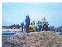
堂坂地区(郡山市)情報管路布設状況 施工 東洋建設