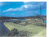
取上樋管(須賀川市)樋管施工状況 施工 福浜工業