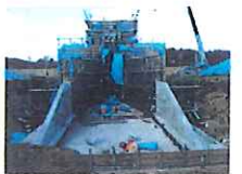
市野開築堤(須賀川市)樋管施工状況 施工 三金興業