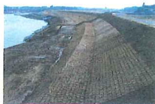
築堤 高倉第2地区 完成 市日和田町 大1建設