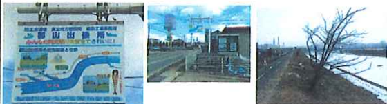
新しくなった出張所の看板

郡山出張所の看板が新しくなりました。郡山市古川地区堤防で、木が発見されました。現在、所有者を捜しておりますが、堤防上の樹木は堤防を弱くさせます。出水期(6月上旬)までには、撤去されることとなります。