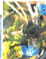
雪の解けた草むらには可憐な青い花を付けた野草

今年度も余すところあと1ヶ月となりました。今年の冬は、例年にない降雪にみまわれ、現場での作業が遅れがちになっていましたが、現場の努力で徐々にではありますが挽回を回り、2月に入って続けて4件の工事完成をさせております。このように現場では、地域の期待に応えるため、土日返上で工事を進めています。最近、道路の汚れ等について苦情を寄せられる件数が増えています。工事の性格上、どうしてもご迷惑をおかけしますが、後1ヶ月でほとんどの工事が完成します。どうぞ、皆様の暖かいご理解とご協力をお願いします。