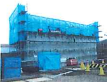
仲の町橋(須賀川市)橋台コンクリート施工状況 施工 滝谷建設工業