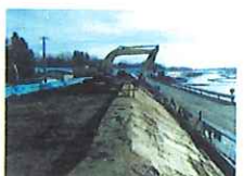
芹沢築堤(郡山市芹沢)築堤土羽仕上げ状況 施工 八光・市川・三栄共同企業体