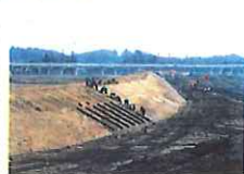
日向の上流(郡山市西田町)芝張り状況 施工 ユニオン建設

今年度も後残すところ1ヶ月となり、各工事現場では、最後の追い込みのため、仕上げ作業に入っています。郡山市内での築堤、護岸工事、須賀川市内での橋梁・樋管工事の状況を紹介いたします。