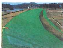
日向の下流(郡山市西田町)芝養生状況 施工 秋田組