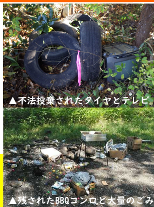
▲不法投棄されたタイヤとテレビ