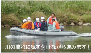
川の流りに気を付けながら進みます！

河川巡視の一環として、船を利用して巡視を 行います。通常はパトロール車で巡視を行って いますが堤防上からは見えにくい護岸の 状態等を確認します。今回の巡視では異状 等の発見はありませんでした。