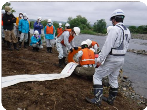
↑ポンプ設置訓練状況