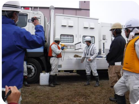
↑排水ポンプ車の操作説明