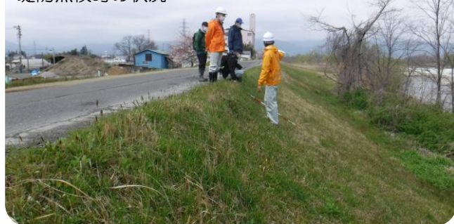
堤防点検時の状況