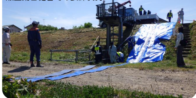
瀬上第2樋管での訓練状況

5/12～5/15、福島市役所による排水ポンプの設置・操作訓練が行われました。 5/14～5/15は、樋管管理者として、各観測員及び伏黒出張所も参加しました。 いざという時に迅速な作業ができるよう、ポンプの設置箇所、作業の流れなどについて関係者で確認しました。