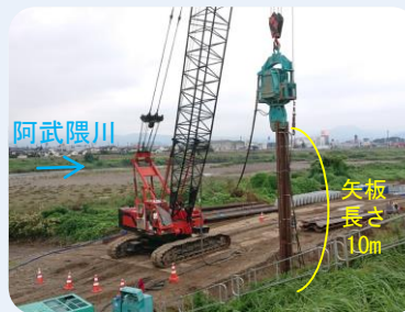
①遮水矢板施工状況