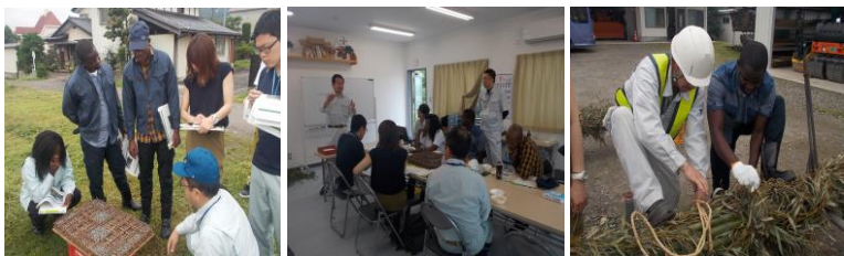
■阿武隈川の現地視察 ■模型を利用した説明 ■技術指導を行う様子

7/23、今年で7年目となる日本の伝統工法である粗朶沈床工(そだちんしょうこう)の実施研修を実施しました。阿武隈川鎌田地区で現地視察後、桑折町の渋谷建設(株)にて工法の説明や枝束ね・結束方法の技術指導を伝授しました。