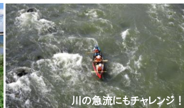
川の急流にもチャレンジ！