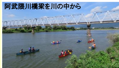
阿武隈川橋梁を川の中から

9/7、カヌー愛好家3団体に参加いただき、「阿武隈川にぎわいプロジェクト」の一環として舟下りを開催いたしました。阿武隈川の直轄改修が始まって100年という節目の年に人と物を運んだ阿武隈川の歴史に思いをはせながら、阿武隈川を楽しんでいただきました。