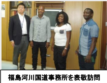
福島河川国道事務所を表敬訪問

粗朶沈床工とは コンクリート護岸が主流の中、細い木を集めて束状にした粗朶が主体の「敷き粗朶」、沈石からなる「沈床工」で構成される河川の根固めや床固めとして採用されてきた伝統工法です。