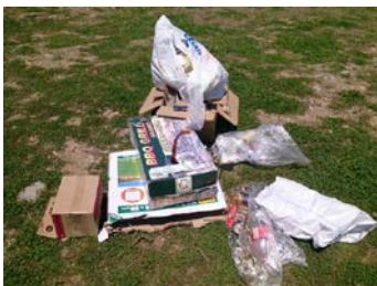
【不法投棄ゴミ種別・箇所数】

また、自然環境や美観を損ねるだけでなく、河川の汚染や悪臭の原因にもなります。地域の皆さんが快く河川を利用できるように、マナーを守りましょう。