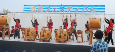
▲ステージショーでは方木田稲荷太鼓の皆さんが勇壮な演奏で観客を魅了。