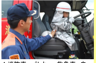
▲消防車、パトカー、救急車、自衛隊の車両を展示。防火衣を着て消防士のミニ体験もできました。