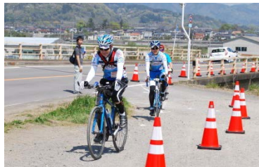
▲産ヶ沢橋川を渡し、大正橋左岸下流のサイクリングロードへ。