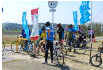
▲旧伊達橋付近のチェックポイント。ここで参加者の皆さんも休憩タイム。

①阿武隈川隈畔の御倉邸で開会式が行われました。開会の挨拶をする福島河川国道事務所の永尾事務所長。②スタート直前。青空の下、スタートの合図を心待ちにする参加者の皆さん。③信夫ヶ丘緑地公園のチェックポイントを回り、松川橋を渡って次は旧伊達橋付近のチェックポイントへ。