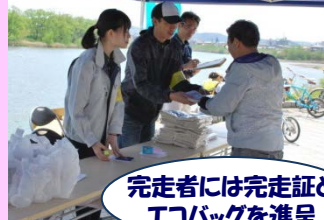
完走者には完走証とエコバッグを進呈