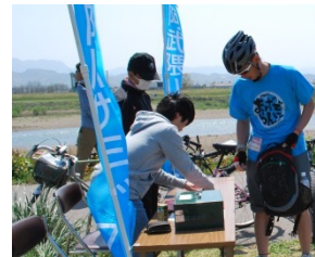
▲チェックポイントでスタンプをゲットして完走を目指そう。