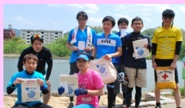
完走された参加者の皆さん