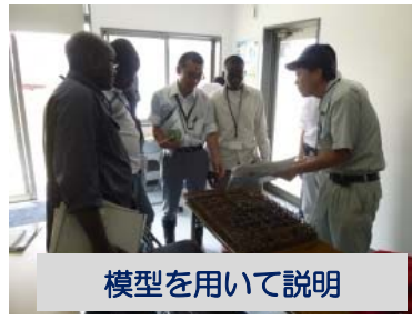
模型を用いて説明