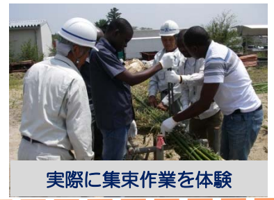
実際に集束作業を体験