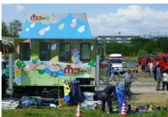
▲洪水体験車「雨ニティー号」。降雨を体験できました

吉井田地区町内会連合会、ふるさとの川・荒川づくり協議会、福島河川国道事務所、福島市などで作る実行委員会の主催、福島民報社などの後援で、5月10日に17回目となる「ふくしま復興・荒川フェスティバル」が福島市の荒川桜づつみ公園河川公園と河川敷で開かれました。吉井田小マーチングバンドの演奏やフリーマーケット、水防展など荒川の自然を満喫しながらいろいろなイベントを楽しみました。