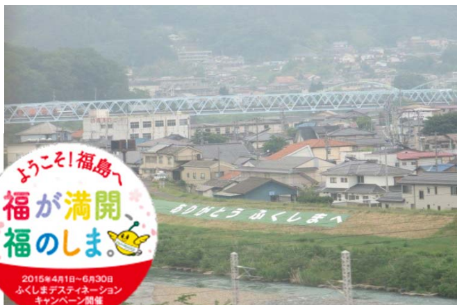
▲縦約30m、横約40m。JR東北新幹線と東北線の車窓から一望できます。