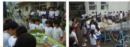
土石流の模型実験 ▶

福島河川国道事務所では河川や道路、砂防などについて皆さんの所へ直接出向いて「出前講座」を行っています。6月20日に伏黒出張所長と吾妻山山系砂防出張所長が水保小学校の4～6年生の55人を対象に総合学習の一環として荒川のことを学ぶ「出前講座」を行いました。荒川の生き物や水害対策、水辺で遊ぶときの注意点を学び、河川環境や土砂災害時の砂防の役割に理解を深めました。