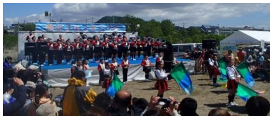
▲オープニングセレモニーで校歌など4曲を演奏した吉井田小マーチングバンド部のみなさん♪