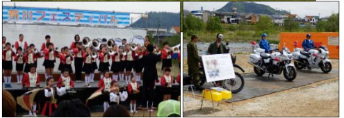
▲「荒川フェスティバル」の昨年開催の様子。水管橋には鯉のぼりが掲げられました。マーチングバンド演奏、白バイや自衛隊の特殊車両の展示なども行われました。

お出かけに最適な季節がやって来ました。出張所管内でも多彩なイベントが開催されますので、ピックアップしてスケジュールをご紹介します。