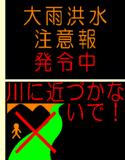
〈大雨洪水時の画面イメージ〉

福島市の信夫橋付近（荒川）と松齢橋付近（阿武隈川）に河川情報表示板を設置しました。河川情報表示板は、水位情報や洪水時の警戒情報を表示することで、沿川住民の方に警戒情報をお知らせします。