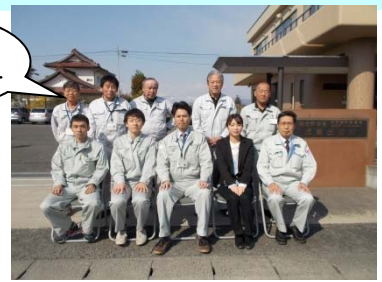
出張所長より一言

平成26年度の伏黒出張所のメンバーです。当出張所では阿武隈川や支川荒川の沿川の皆様が安全で安心できるよう河川事業や河川管理を行っています。