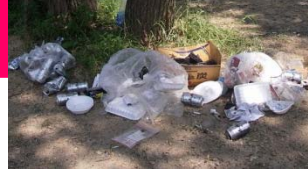
▲昨年、実際に公園内に投棄されたゴミ。空き缶が散乱し、瓶ビールがケースごと捨てられる悪質な投棄もありました。

荒川桜つつみ公園の河川敷は、バーベキューなどで多くの方に利用されています。しかし毎年、ゴミを持ち帰らず放置するなどマナーの悪さが大きな問題となっています。不法投棄物の回収・処分費用は税金が使われています。市民の皆さんが快く河川敷を利用できるように、必ずゴミは持ち帰りましょう。