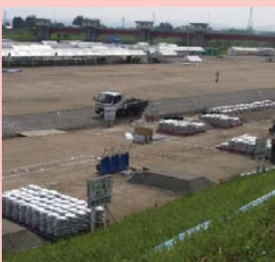
(会場整備のイメージ)

水防演習の会場整備のため、5月7日(火)から荒川運動公園において整備作業を行います。整備期間中は近隣住民の皆様や運動公園利用の皆様には大変ご迷惑をおかけしますが、ご理解とご協力をよろしくお願いいたします。