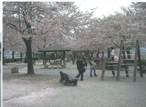
安全に気をつけて使いましょう♪