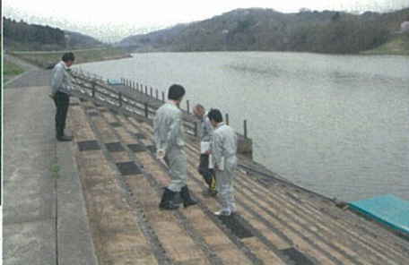
危険な箇所はないかな？