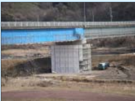
工事中の三本木橋です