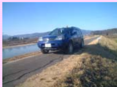
河川パトロール中です！

また福島市～宮城県境までの阿武隈川について、船による巡視を年1回実施しています。河川管理施設（樋門、樋管、堤防等）の状況、不法行為（放置車両、不法占用等）の監視等を行っていますが、最近はゴミの投棄、特に大型家電製品の投棄が多く大変困っています。