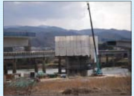
工事中の梁川大橋です