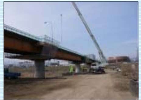
工事中の鎌田大橋です