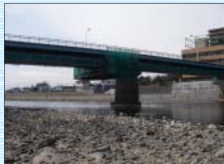
工事中の天神橋です