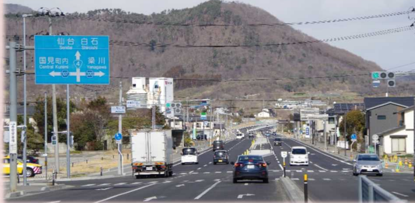
開通日の様子 (R6.3.9撮影)

完成までの間、地域の皆さまをはじめ道路利用者の方々には、多大なるご協力をいただき大変感謝しております。