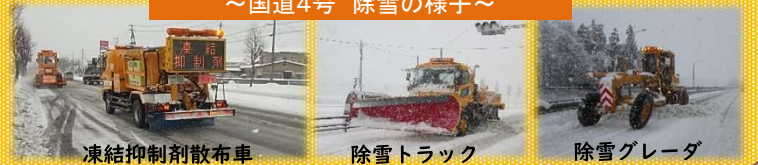
～国道4号 除雪の様子～