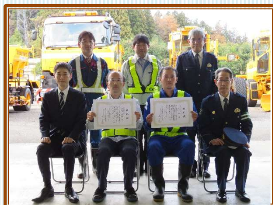
受賞者の皆さま、おめでとうございます。 昼夜問わずご尽力いただき、ありがとうございます！