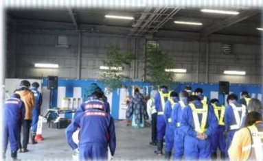
～安全祈願祭の様子～

当日は、作業員と除雪機械の安全を願い安全祈願祭が行われ、また長年にわたり道路除雪に従事いただいた方々の功績を讃え、表彰式を行いました。