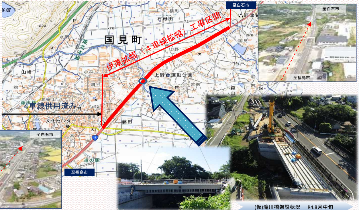
(仮)滝川橋架設状況 R4.8月中旬

国道4号（本宮市荒井～国見町貝田）及び 国道13号（福島市杉妻町～森合町）の管理を行っています