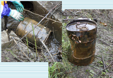
ドラム缶が出現！排水不良の要因となっていた