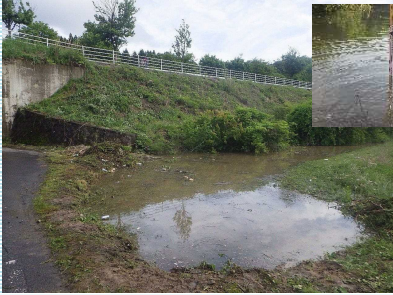
国道下の排水路を確認すると大きなため池ができていた

昨今、ゲリラ豪雨や雹・落雷等の天気急変の報道を目にすることが多くなりましたね。二本松市地内にておいてもゲリラ豪雨により、国道施設で冠水が発生しました。今回の冠水の主な原因は、不法投棄物により水路が塞がれ側溝から水があふれた、いわゆる『人災』でした。不法投棄は犯罪です。安心安全な通行が出来るよう、ご協力お願いいたします。