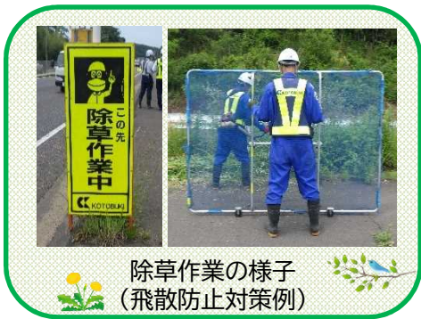
除草作業の様子 (飛散防止対策例)

国道4号における歩道の除草計画を以下の通り予定しております。 (作業にあたっては、雑草等の繁茂状況に応じて優先的に行う箇所があります) なお、作業中は歩行者や走行車両の安全確保のため、やむを得ず車線規制を伴うこともありますのでご理解、ご協力をお願いします。