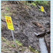
不法投棄禁止警告看板設置