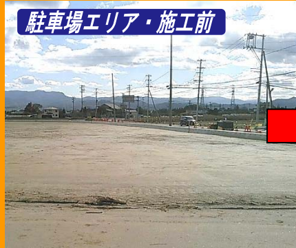
駐車場エリア・施工前