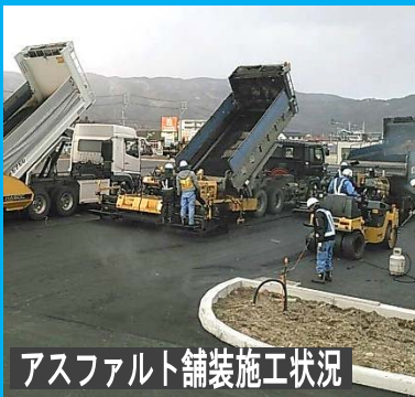
アスファルト舗装施工状況