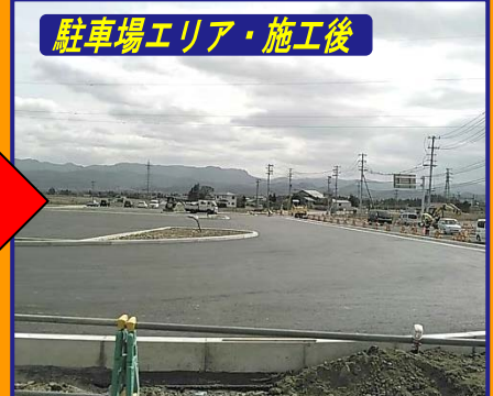
駐車場エリア・施工後